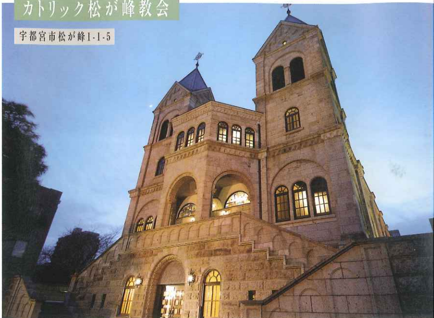
「大谷石を用いたキリスト教会で、双塔をもち、ロマネスク様式でつくられた貴重な近代建築である」 (写真と文：NPO 法人大谷石研究会「大谷石百選」より)