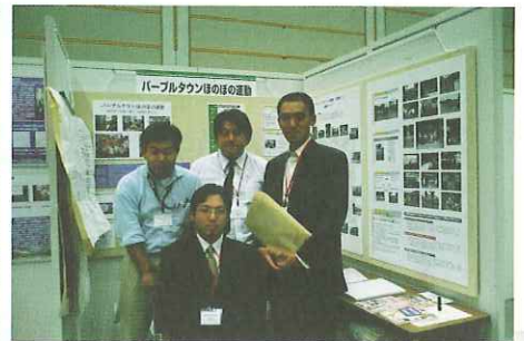
建築士会全国大会・三重大会 2002/10/17・18 関東ブロック代表、お疲れさまでした。